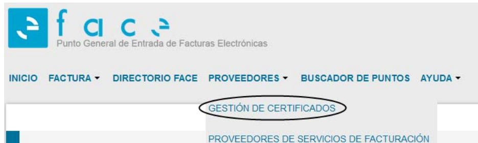
Ilustración 5: Acceso certificados proveedores

http://valide.redsara.es . FACe permite la autogestión de estos certificados a los proveedores directamente, a través del portal face.gob.es .