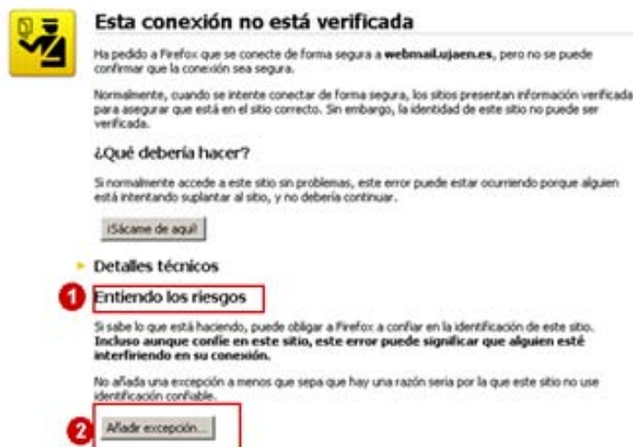
Ilustración 6: Pagina de alerta de conexión no segura.

Lo que debemos hacer es añadir una excepción de seguridad instalando permanentemente el certificado recibido. Para ello siga los siguientes pasos: